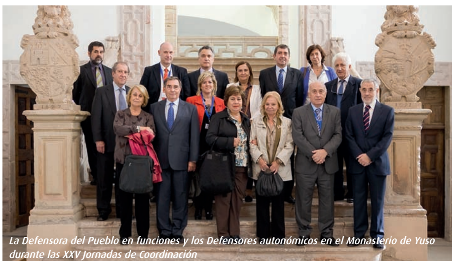
La Defensora del Pueblo en funciones y los Defensores autonómicos en el Monasterio de Yuso durante las XXV Jornadas de Coordinación

Tras analizar las consecuencias de la crisis en la economía, la vivienda y la propia ac-