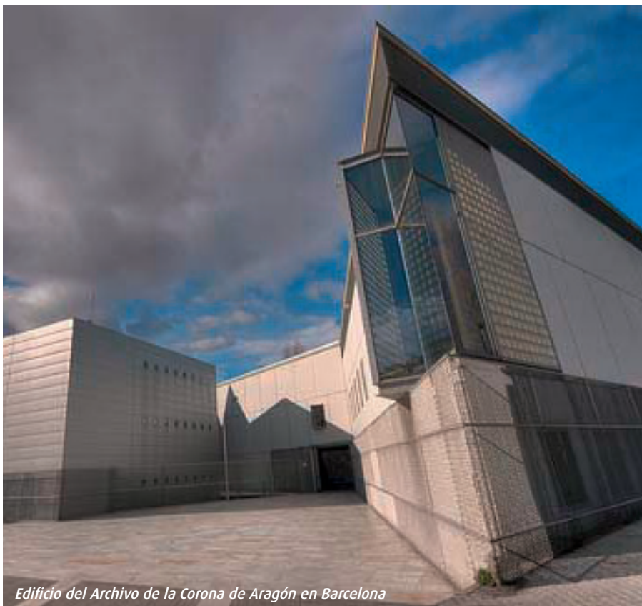
Edificio del Archivo de la Corona de Aragón en Barcelona

En fin tendremos que seguir defendiendo lo evidente, que el Archivo Real era del Rey de Aragón y que su unidad responde al propio monarca y no es susceptible de división entre los distintos territorios que estuvieron bajo su poder.