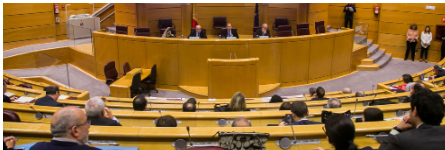
Pie de foto: Sesión del V Foro de las Autonomías.

Tras la inauguración, tuvo lugar la presentación de la valoración general del año autonómico, con las siguientes conclusiones: el año 2015 ha sido básicamente un año electoral, ya que se han celebrado elecciones locales, elecciones generales y elecciones en todas las CCAA salvo País Vasco y Galicia. En todas ellas se produjo una gran pérdida de votos de los dos grandes partidos, así como la consolidación de los nuevos partidos emergentes, de modo que los Parlamentos autonómicos elegidos tienen representaciones políticas fragmentadas. A su vez, a partir de las elecciones generales se ha consolidado un nuevo sistema "tetrapartidista imperfecto", es decir, con cuatro grandes partidos estatales, otros más pequeños, y partidos con vocación mayoritariamente autonómica. La Cámara baja se asemeja